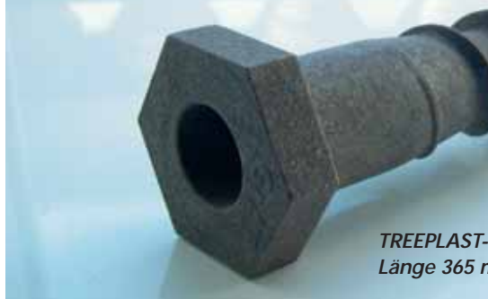
TREEPLAST- Länge 365 mm

TREEPLAST vereinigt als Biokunststoff die Vorteile von nachwachsenden Rohstoffen mit denen der modernen Kunststoffverarbeitung, wie dem Spritzguss. Die unterschiedlichsten biogenen Materialien können in diesem Verfahren zu Serienprodukten verarbeitet werden und sind wie Holz weiterverarbeitbar. Die Verwendung dieses Biokunststoffs erlaubt einen problemlosen Rückbau und die Rückführung in den biologischen Kreislauf.