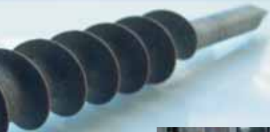
Strohschraube mm, ø 37 mm

Nach der bionischen Optimierung. Die roten Bereiche sind verschwunden, obwohl der Gewindegrund nur geringfügig verändert wurde.