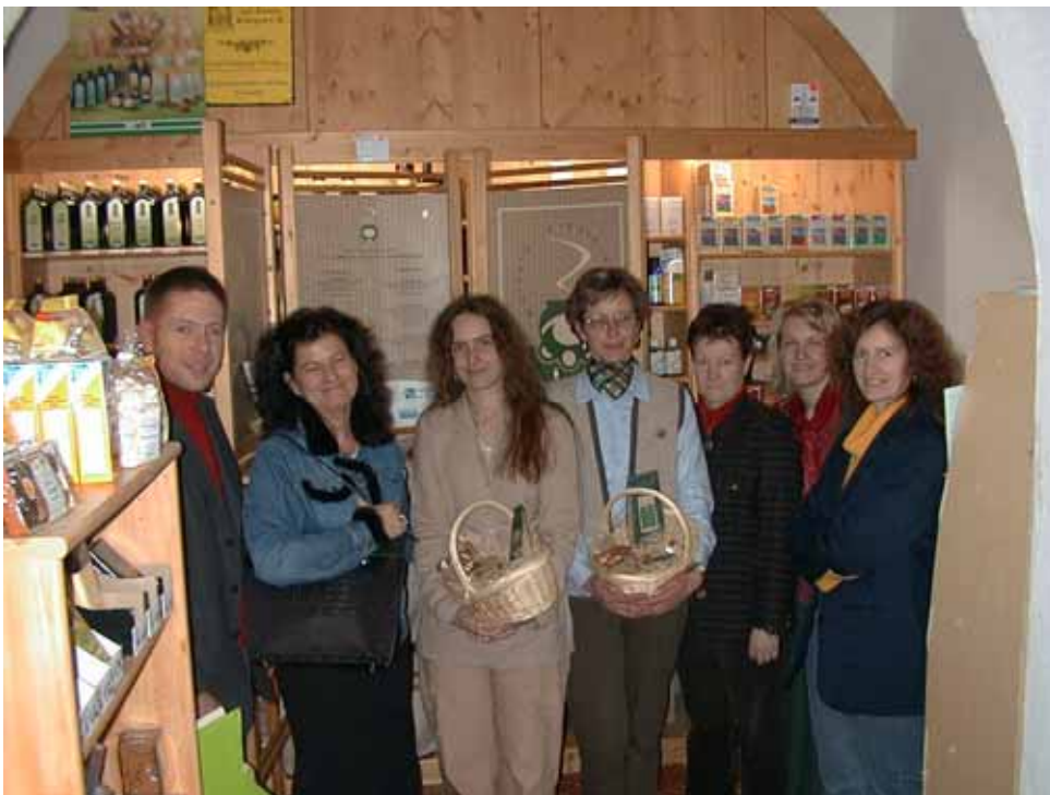
Abbildung 1: „Kräuterhexen“ im Naturstüberl Penitz