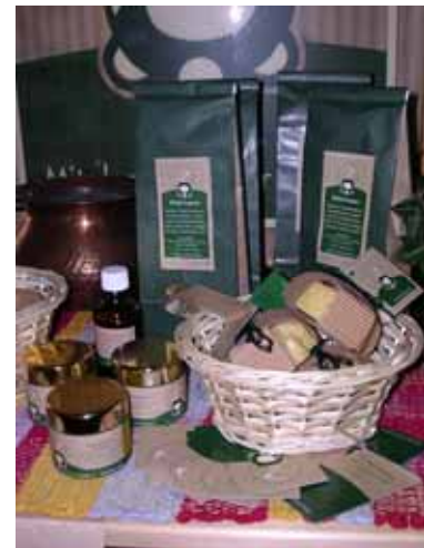
Abbildung 6: Produkte und Verpackungen