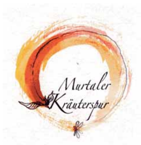
Abbildung 3: Logo „Murtaler Kräuterspur“

Der Kreis steht für die Gruppe, das Netzwerk, die Farben symbolisieren die Harmonie in/aus der Natur, die schwarze Linie signalisiert die Spur. Es ist auch optisch ansprechend gestaltet. Der Nachteil, es wirkt in Schwarzweiß nicht, auch nicht bei kleinen Abbildungen.