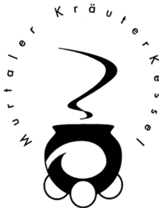
Abbildung 2: Logo „Murtaler Kräuterkessel“

In der Projektgruppe wurden aus den verschiedenen Entwürfen 3 Favoriten herausgearbeitet. In einer intensiven Analyse kristallisierte sich heraus, dass die Marke „ Murtaler Kräuterkessel “ den Anforderungen hinsichtlich Vermarktung der Produkte und auch der Seminare, sowie der Identität und Philosophie am besten entspricht.