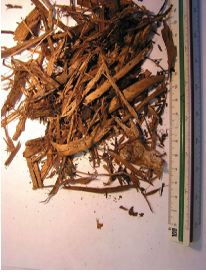
Grünschnitt / Gartenabfall