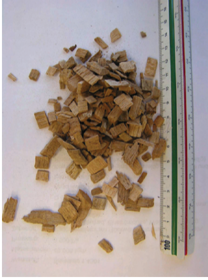
Holzhackschnitzel, 8 mm